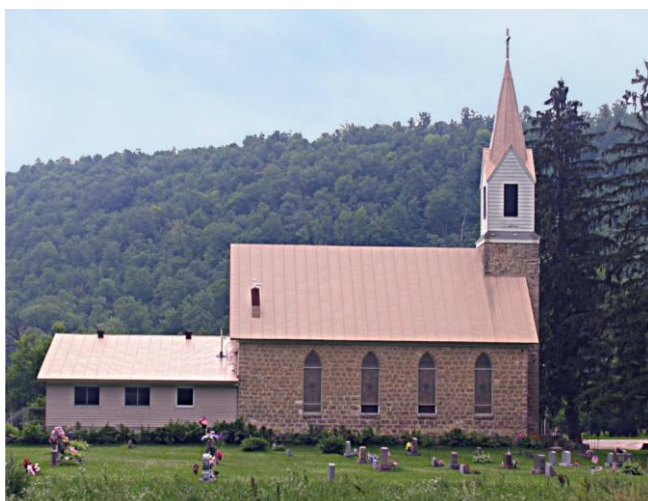
På gravsteinane ved kyrkja i Coon Walley var norske namn dominerande