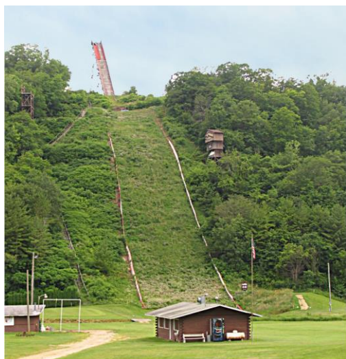
Coon Walley er stekt norskprega også når det gjeld sport.