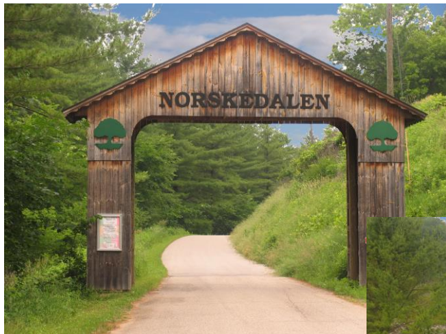
Inngangsporten til Norskedalen

Coon Walley i Wisconsin er eit område med mykje norsk busetnad. Området ligg ved bygdesentrumet Westby ein halvtimes køyring søraust for byen La Crosse.