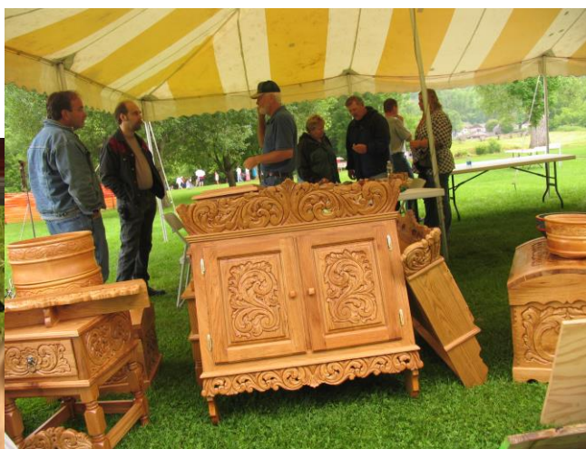
Sal av husflid..