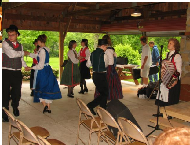
Leikarringen var frå Decorah