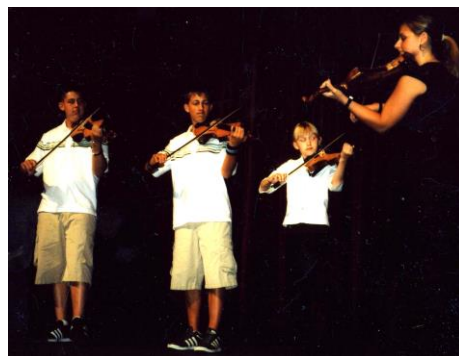
Juniorpelemenn frå Gig Harbor Spelemannslag på AmeriKapp- leiken 2003

Laget spelar hovudsakleg svensk og norsk folkemusikk som dei har tileigna seg frå plater og notar. Dei har lite musikk frå eldre norsk-amerikanske tradisjonsberarar. Underteikna har fått lov å vere med dette laget og lært dei nokre runddansslåttar frå Sunnfjord.