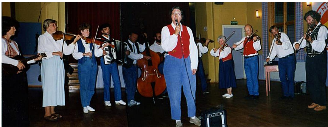
Skål Klubb Spelemannslag heldt konsert i Førde i 1995

heime. Likevel kan ein merke at dei opptrer friare i høve til vår tradisjon, enn kva vi gjer i Noreg.