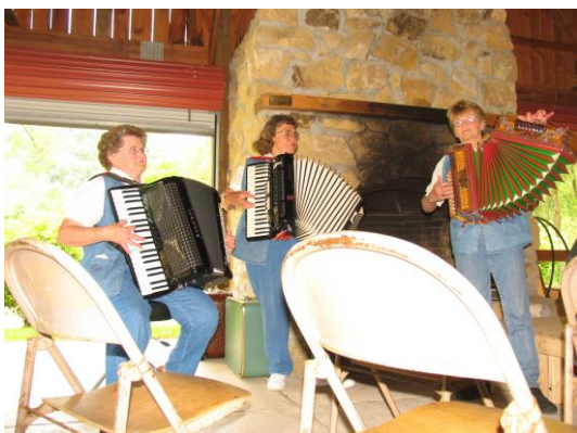
The Happy Wanderes