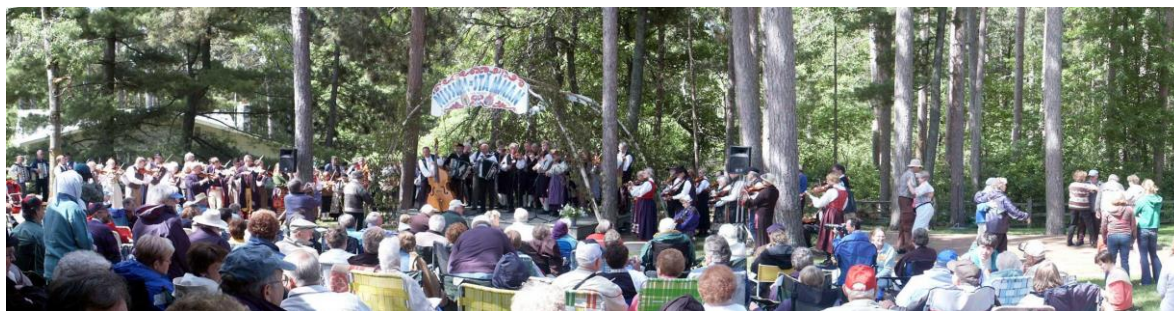
120 spelemenn i allspel på Nissvastemnet i 2006

Dette er eit stemne som vart arrangert for 6. gong i 2006. Føremålet med stemnet er å presentere musikk frå, eller som har sitt opphav i dei Skandinaviske landa. Underteikna