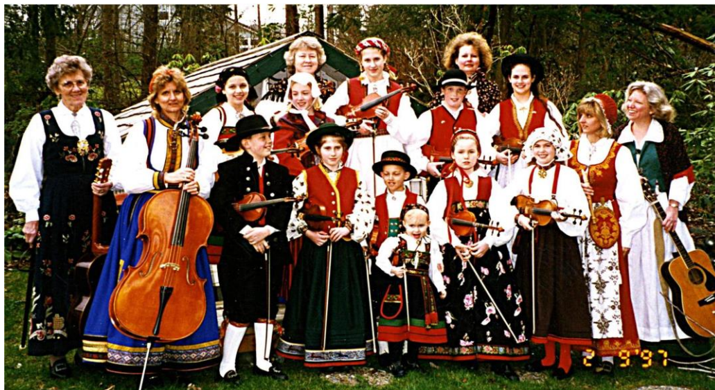
Gig Harbor Spelemannslag