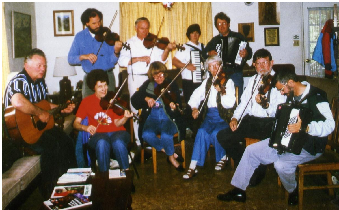
Spelemannslaget i Nordahl Grieg Leikarring under kurssamling i oktober 1997.

Då Naustedalen Spelemannslag var på reise i USA i 1991 var vi gjestar hos Nordahl Grieg