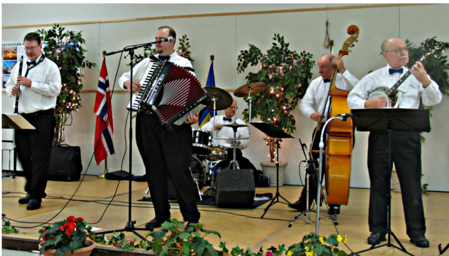
Leikarring frå Paulsbo