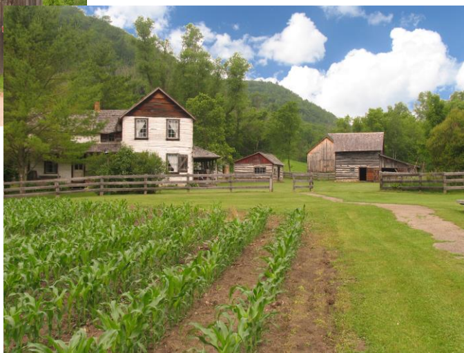
Norskedalen er tilrettelagt med bygningar og areal slik det såg ut etter at ein innvandrarfamilie frå Noreg var etablert.

Svært mange av busetjarane her kom frå Austlandet, men det var også folk som fortalde at forfedrane kom frå Sogn. Eldre folk av 3. og 4. generasjons innvandrarar snakkar framleis norsk, Her ligg museumsgarden Norskedalen som er tilrettelagt med bygningar og areal