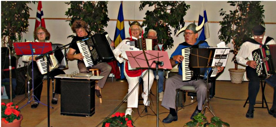
Smilin Scandinavians og songkor.