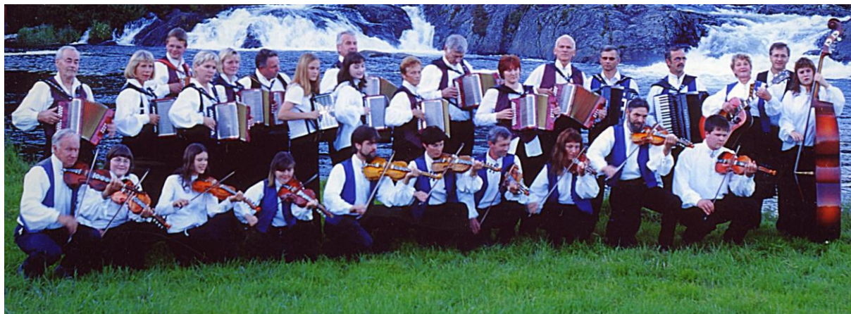
Naustedalen Spelemannslag på veg mot nye femti år.