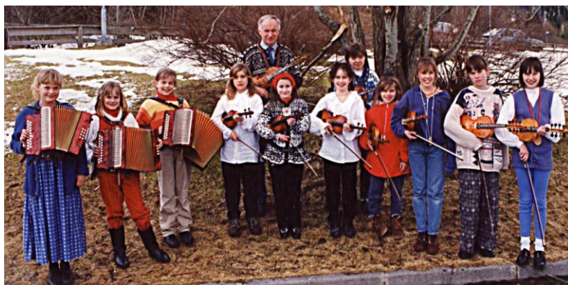
Laget har hatt deltakarar på dei fleste fylkesjuniortreffa. Her er vi i Hornindal.

Av speleoppdrag og tilskipingar kan nemnast to leikfestar på Trollstova, og ein triveleg tur til Gulen med gamaldansfest på Oppdalsøyra. Dette året vart det ingen romjulsfest, grunna vanskar med å samle medlemene til felles innsats. Kursaktiviteten var stor