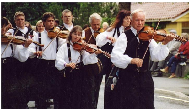
År om anna er Naustedalen Spelemannslag med på Førde Internasjonale Folkemusikkfestival, som her i 2002.

Naustedalen spelemannslag fekk meir å henge fingrane i då det lei litt uti 2002. Laget hadde teke på seg å skipe til Fylkeskappleiken, og sjølv om dette ikkje er nokon avskrekkande stor kappleik, så er det utruleg mykje som må ordnast. Arena for kappleiken skulle vera den flunkande nye Naustdalshallen. Laget deltok ved den offisielle opninga av hallen i januar, og bruken av hallen med birom som kappleiksarena vart planlagt i detalj. Då kappleiken starta