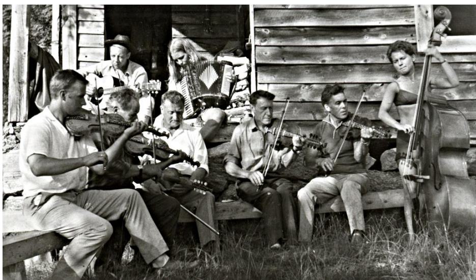
Mellom øving, tilskipingar og oppdrag vart det også tid til avkobling. Her er medlemmer av laget på tur til Vonastranda.