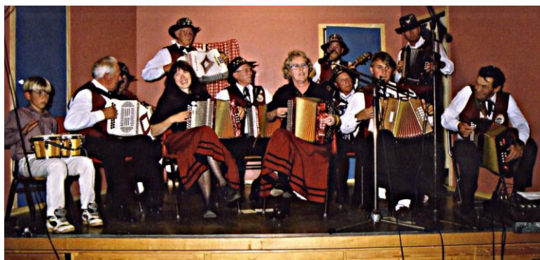
Vestfold Toraderklubb på scena i Instedalen skule.

I førstninga av august kom Vestfold toraderklubb på vitjing, og det vart både fredagsdans på Instedalen skule og laurdagskveld på Vona. Toraderlaget sytte for dansespel