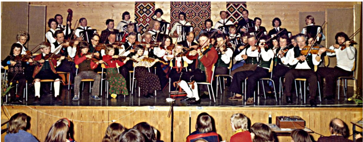
Spelemannsfest i Naustdal. Naustedalen Spelemannslag med nybyrjar- og trekkspelkurset som medspelarar. Dette var dei åra tidleg på 70-talet då vegegane ”bula” ut i aulaen på Naustdal barne- og ungdomsskule.