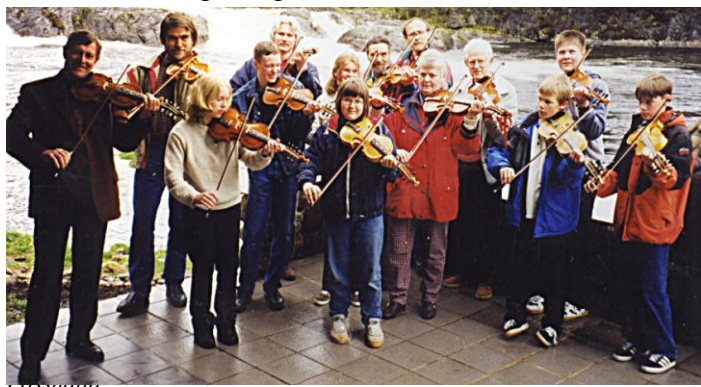
Naustdal var vertskap for eit tre-dagars felekurs med Sven Nyhus. 3 frå Naustedalen – var med.

Kursa frå i fjor heldt fram i vårsemestret. I juniortreffet på Byrkjelo i mars deltok 4 frå det vidarekomne felekurset. Skuffande svak interesse frå dei unge sett på bakgrunn av at laget hadde 16 "lærlingar" i denne målgruppa. Dei mest interesserte frå desse kursa deltok i dei ordinære lagøvingane i haustsemestret. I Mo-kurset hadde laget 8 deltakarar, 6 med